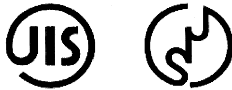
図-1 旧 JIS マーク と現行の JIS マーク